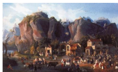
Figura 67 Salvatore Fergola il progetto del presepe di Palazzo Reale a Caserta voluto da Ferdinando II nel 1844, raffigurato su quattro tele a tempera, conservate nella sala ellittica di Palazzo Reale a Caserta